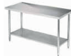
MESÓN TRABAJO CENTRAL SKU: MT090CCO SKU: MT140CCO SKU: MT190CCO