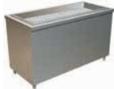
SKU: BMM110EO Med: 110x65x85cm