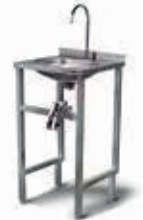
LAVAMANOS LLAVE RODILLA SKU: LM045ECR