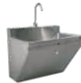
LAVAMANOS MURAL INCLINADO SKU: LQE701TF