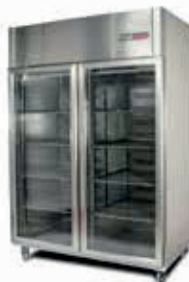
VISICOOLER 2 PUERTA SKU: VV0038CO2