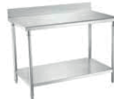
MESÓN TRABAJO MURAL SKU: MT090MCO SKU: MT140MCO SKU: MT190MCO