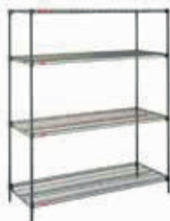
ESTANTERIAS DE 4 REPISAS ACERO CARBONO Diferentes Medidas