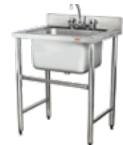
LAVADERO 1 TAZA LÍNEA EUROPEA SKU: LL061000 CONSULTE OTRAS CAPACIDADES