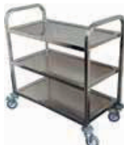
CARRO UTILITARIO AC. INOXIDABLE O COBRE SKU: KAST110140