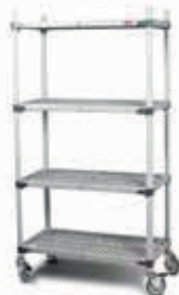
ESTANTERIA 4 REPISAS POLÍMERO Diferentes Medidas