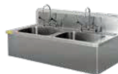
LAVAMANOS QUIR. 2 TAZAS SKU: LQ1402TF CONSULTE OTRAS CAPACIDADES