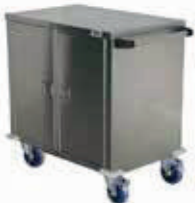
CARRO TRANSPORTE MAMADERAS AC INOX. SKU: CM080128 - 128 Mamaderas SKU: CM096192 - 192 Mamaderas