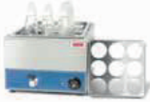
SKU: BME018SM Med: 55.5x35.5x25.5cm