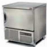
ABATIDOR DE TEMPERATURA SKU: AB005IBI