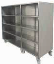
ESTANTE FULL SPACE ACERO INOXIDABLE SKU: EFS19070 - 190cm SKU: EFS24090 - 240cm