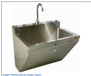
Imagen Referencial de Equipo Oppici.